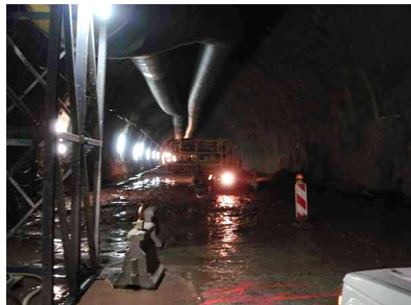
Blick auf die Tunnelbaustelle