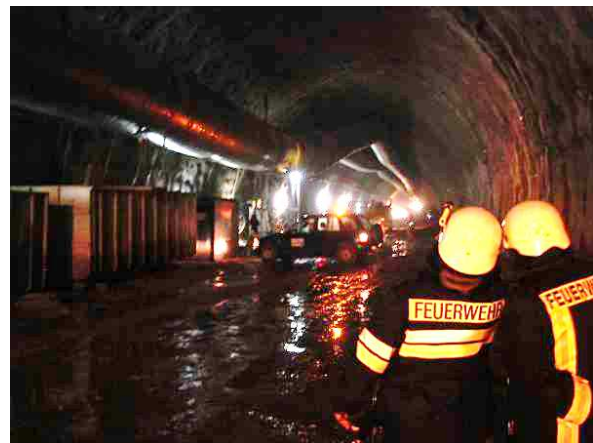
Rauchausbreitung bei Brandversuch