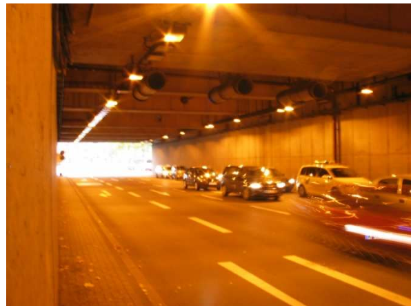
Blick in eine Tunnelröhre